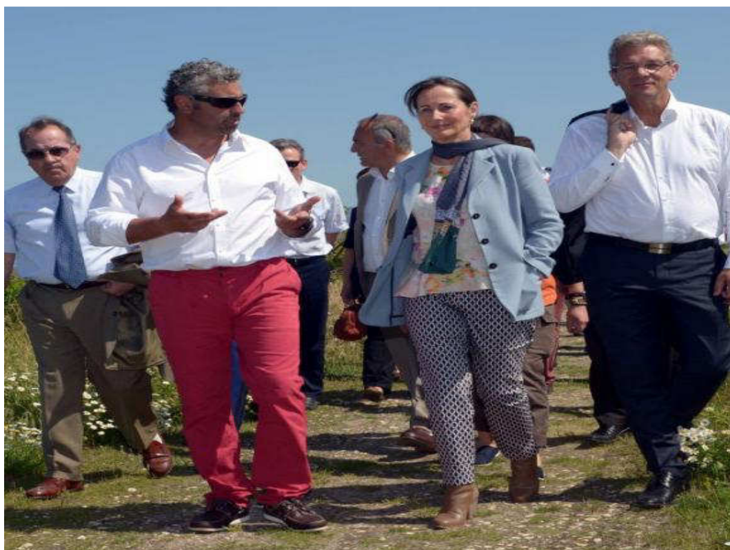
Ségolène Royal entourée de journalistes à Arcachon fin juin 2014.